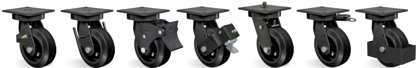
FL - Freno Lateral