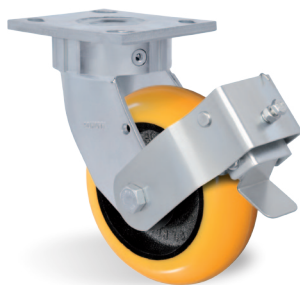
Freno Pedal - FP