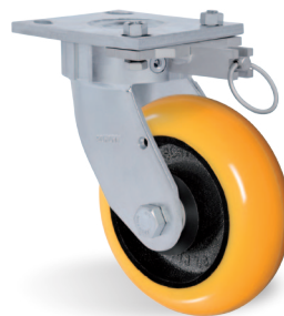
Bloqueo de Giro - AD