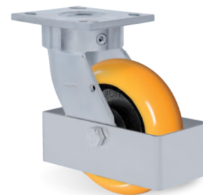
Guarda Cuerpo - GC