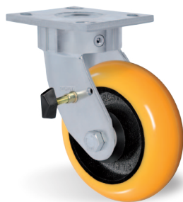
Freno Lateral - FL