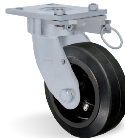
Bloqueo de Giro - AD