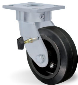
Freno Lateral - FL