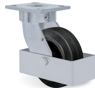
Guarda Cuerpo - GC