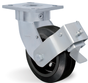
Freno Pedal - FP