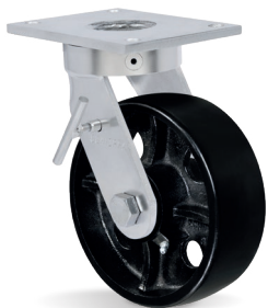
FL - Freno Lateral de Rueda