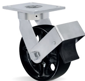
FP - Freno Pedal