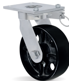
AD - Bloqueo de Giro