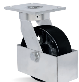
GC - Guarda Cuerpo