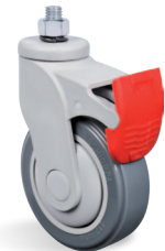
FP - Freno Pedal