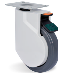
DA - Freno Pedal