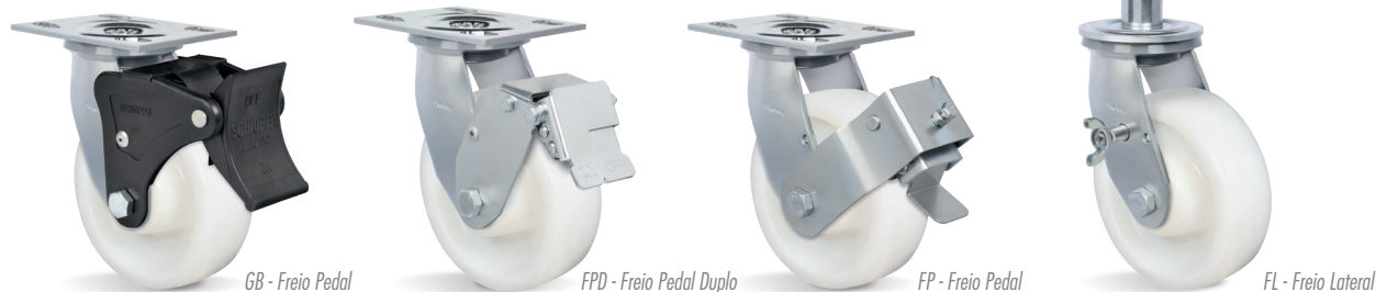
GB - Freio Pedal