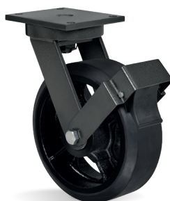
FP - Freio Pedal