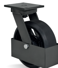
GC - Guarda Corpo