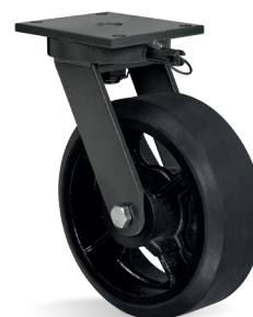
BG - Bloqueio de Giro