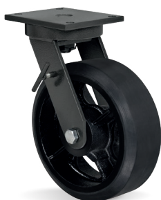
FL - Freio Lateral