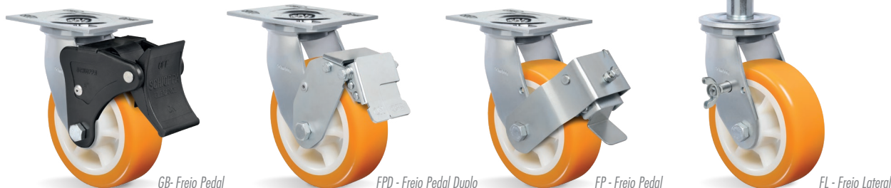
GB- Freio Pedal *Disponível somente para 52 e 62