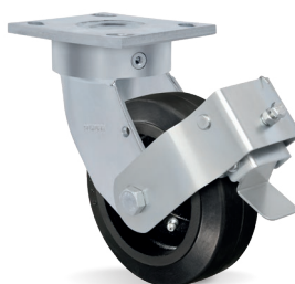
FP - Freio Pedal