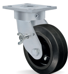
FL - Freio Lateral