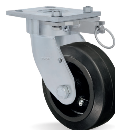
AD - Bloqueio de Giro