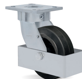
GC - Guarda Corpo