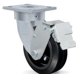
FPD - Freio Pedal